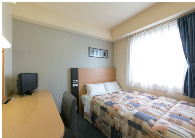
ダブルエコノミー